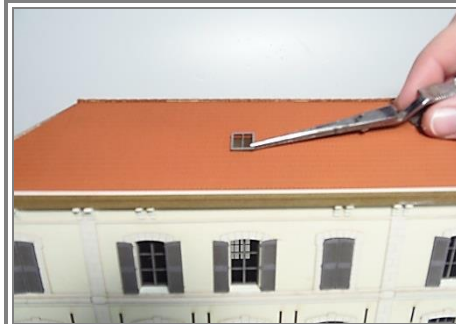
Coller les fenêtres de toit par-dessus.