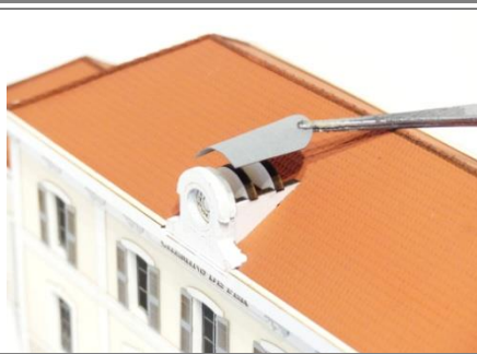
Mettre en place la toiture de l'horloge, il est plus aisé de contraindre le carton sur un cylindre aupréalable.