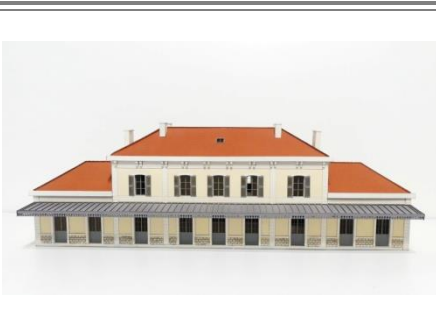
Votre bâtiment est terminé, vous pouvez le détailler et le patiner selon vos envies.