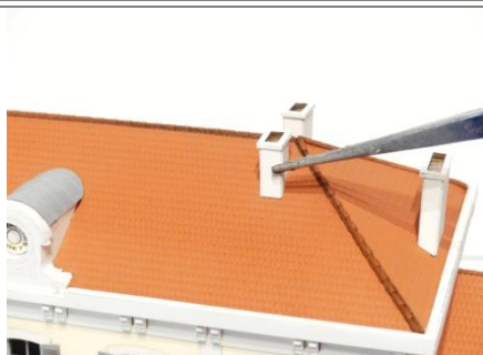
Coller les cheminées en place -des réserves existantes sur la toiture-

Pour les sur-épaisseurs de la marquise, l'emploi de colle en bombe (marque "3M" -bleue) facilite le travail