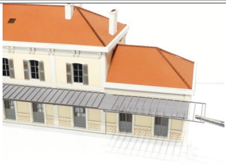
Mettre en place la marquise en commençant par coller les appuis dans les trous prévus dans les murs à cet effet.