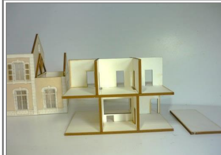
Découper puis assembler et coller les cloisons de l'aménagement intérieur. Il n'y a qu'une seule possibilité de montage grâce aux détrompeurs. Téléchargement gratuit des décorations de murs et sols sur notre site, rubrique GOODIES.